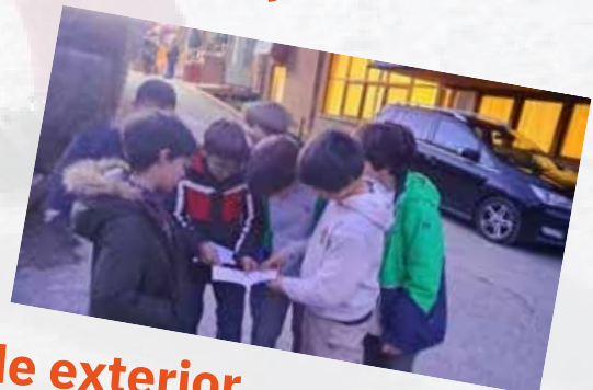
Juegos de exterior